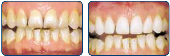
Voor het bleken

bepaalde voedingsstoffen veel gebruikt. Het effect van langdurig of herhaald bleken op het tandweefsel is nog niet helemaal bekend. Bleek uw tanden daarom onder toezicht en controle van uw tandarts of mondhygiënist.