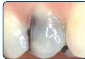
Grijze of zwarte vulling