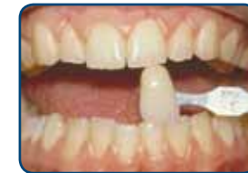
Het uitzoeken van de juiste kleur

het thuis bleken met een bleeklepel, zijn het ruwer worden van de tanden, de hogere kosten en op de lange termijn een minder goed bleekresultaat.