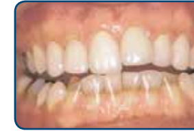
Ontwikkelingsstoornissen in de tandkiem