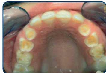
Tanderosie bij een kind van 8 jaar

Meestal merkt u tanderosie pas op in een vergevorderd stadium. Als u klachten krijgt bij het eten of drinken bijvoorbeeld. Vaak is het tandglazuur dan al verdwenen. Tanderosie kunt u pas herkennen als het uiterlijk van de tanden verandert. De voortanden worden korter, dunner en doorschijnender of krijgen rafelige randen. De tanden worden (plaatselijk) steeds geler of de tanden krijgen donkere plekken. Het glazuur wordt namelijk