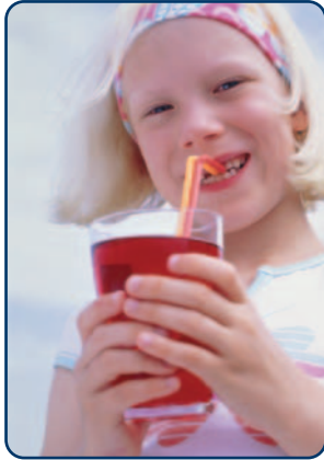
Er worden vaker en meer fris- en sportdranken gedronken

Gaatjes (tandcariës) worden veroorzaakt door bacteriën in de mond. Deze mondbacteriën vormen zuur uit suikers en andere koolhydraten (zoals in bijvoorbeeld pasta, aardappelen en brood). Dit zuur veroorzaakt tandcariës. Tanderosie is slijtage van het tandglazuur door zuren uit eten en drinken of uit de maag. De laatste jaren zijn de voedingsgewoonten ingrijpend veranderd. Zo worden vaker en meer fris- en sportdranken gedronken. Dat heeft tanderosie tot gevolg. In deze folder leest u hoe u tanderosie kunt voorkómen.